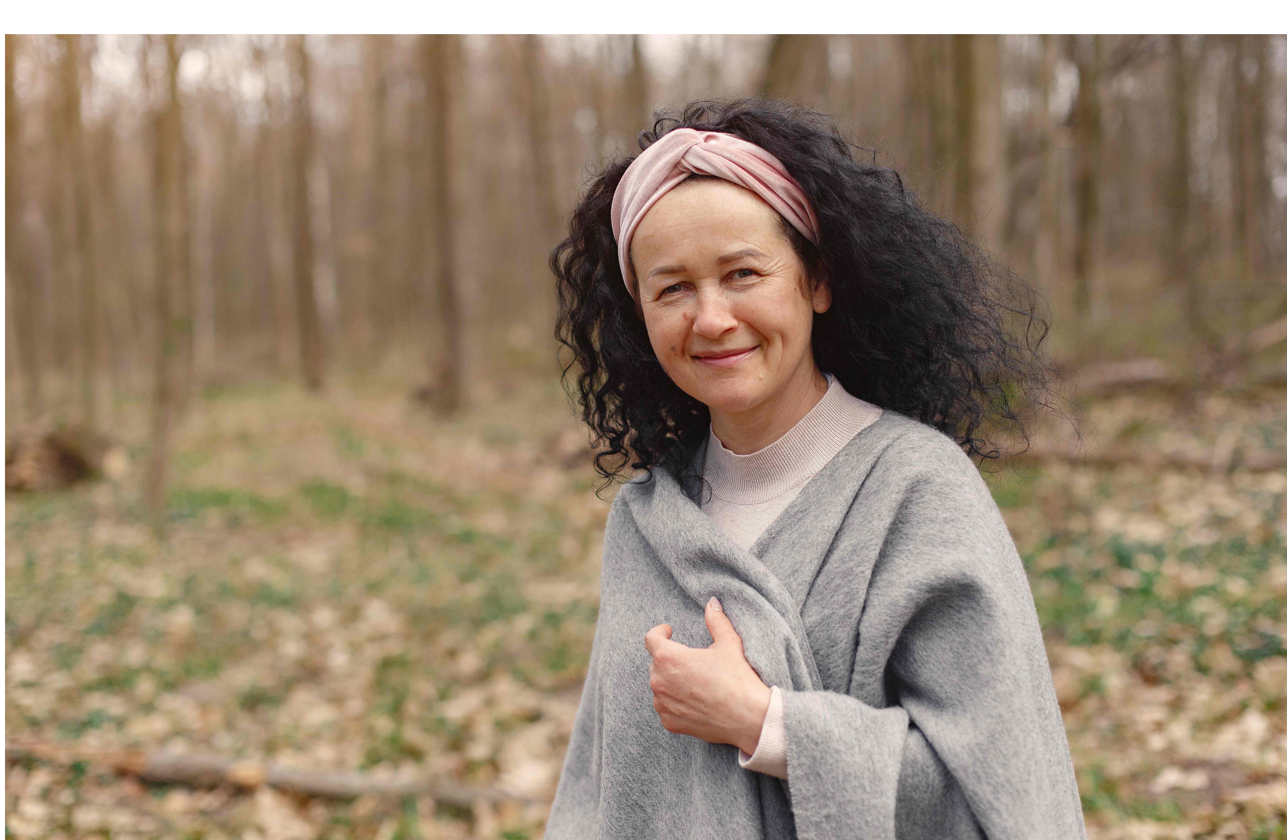
I Longennials rappresentano in termini di patrimonializzazione la terza economia al mondo