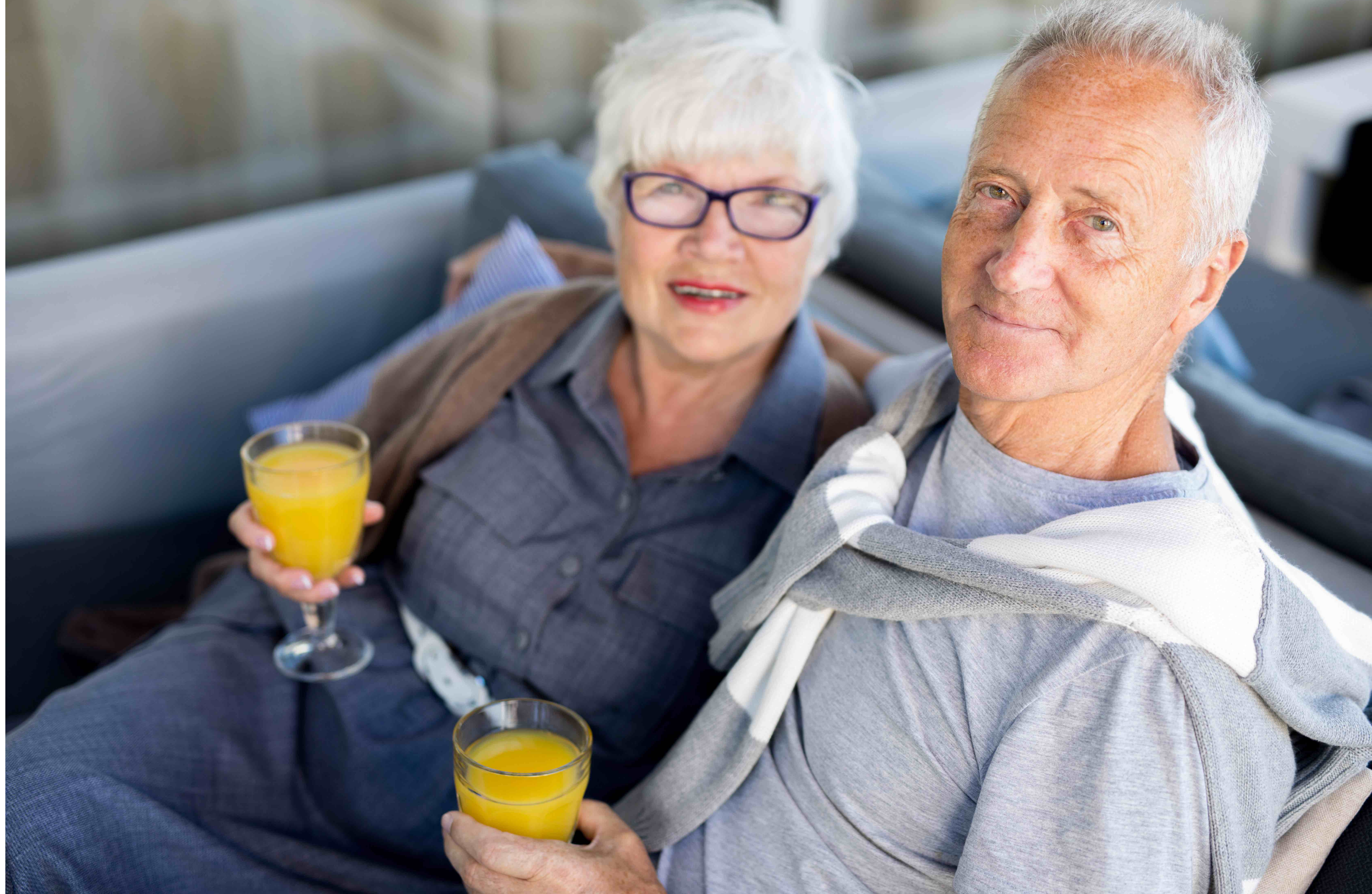
I Longennials rappresentano la Silver Economy

Sono e saranno le persone attive, intraprendenti e volitive a trainare la ripresa dopo l'esperienza del Covid-19. E a quanto pare, gli attivi non hanno età, si trovano in tutte le generazioni.